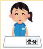
受付業務 (温泉、プール、トレーニングジム)