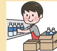
コンビニでの業務体験